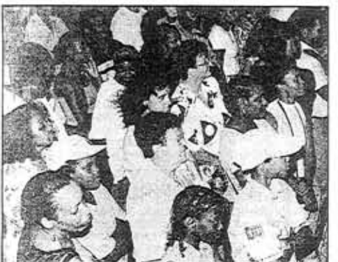
Beaucoup de monde pour la fête.