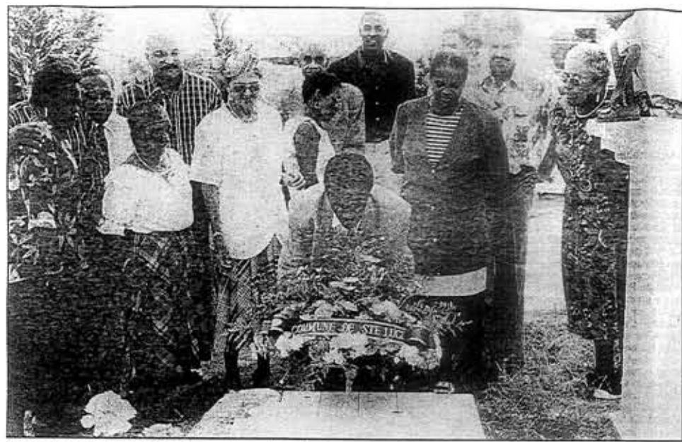
Moment émouvant : le dépôt d'une gerbe sur la tombe du premier maire de Sainte-Luce.