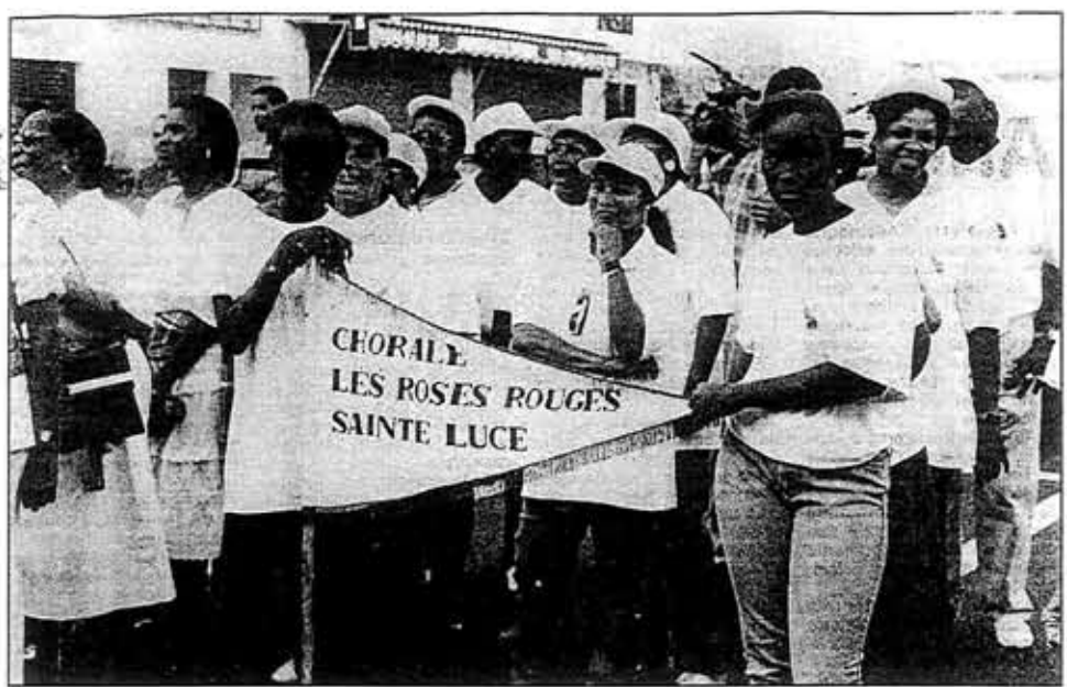
La chorale «Les roses rouges».