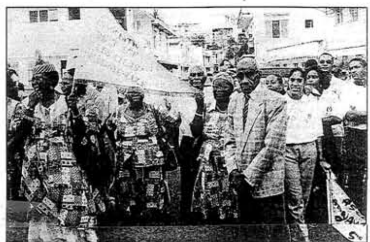
Les «Lilas» de Sainte-Luce.