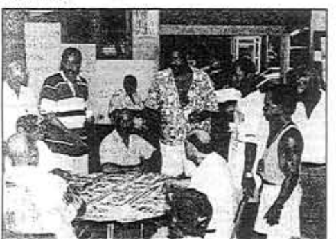
Les tournois de belote et de dominos ont obtenu un vil succès.